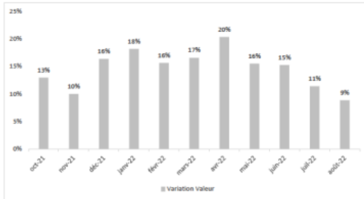
Variation mensuelle en % par rapport au même mois de 2019

CUMUL ANNUEL A DATE VS 2019 EN VALEUR : +15,1% EN VOLUME : + 8,5%