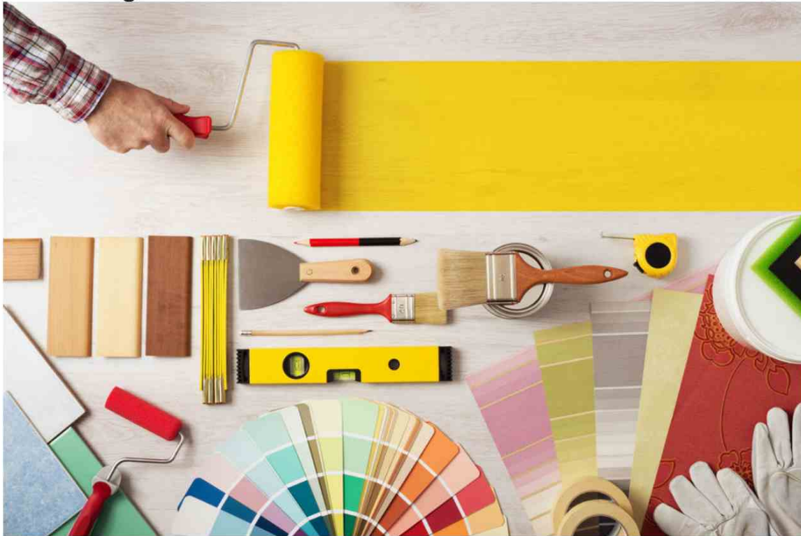
Un mois de juin 2022 en baisse mais avec une base de comparaison élevée

Les grandes surfaces de bricolage (Leroy Merlin, Castorama, etc.) ont vu leurs ventes baisser en juin 2022. Mais la base de comparaison était élevée et, par rapport à 2019, le secteur s'affiche encore largement en croissance.